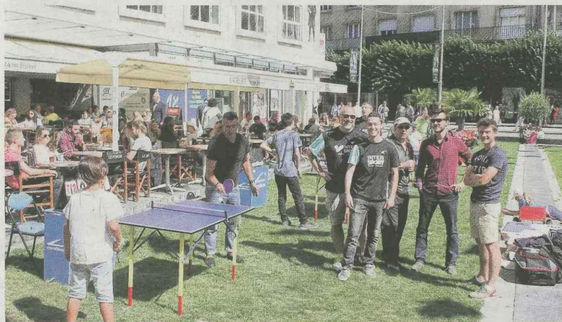
Les responsables du club à la rencontre du grand public.

Amiens Sport Tennis de Table a pris en charge l'animation de la place Gambetta hier après-midi