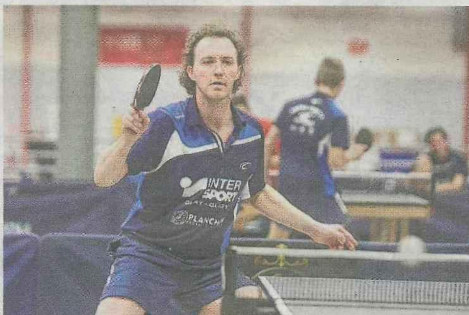
Vostes et l'Amiens STT reprennent le championnat, samedi à domicile.

Cyclo-cross de Montdidier (premier départ à 12 heures)