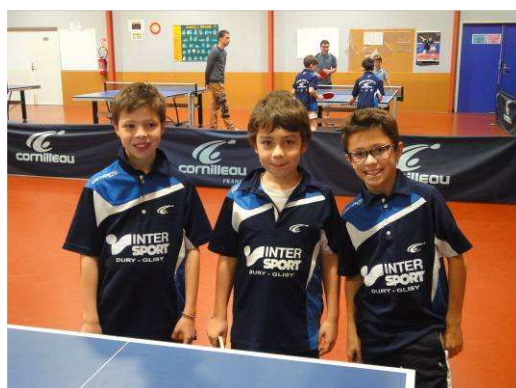
L'équipe jeunes de D2 montant en D1