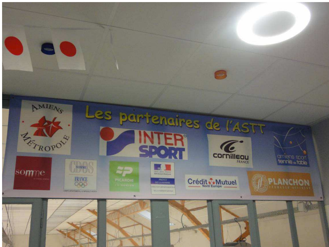
La banderole de nos partenaires dans le club-house

Toi aussi recrute !! et participe à l'affichage de nouveaux partenaires sur les murs du club !