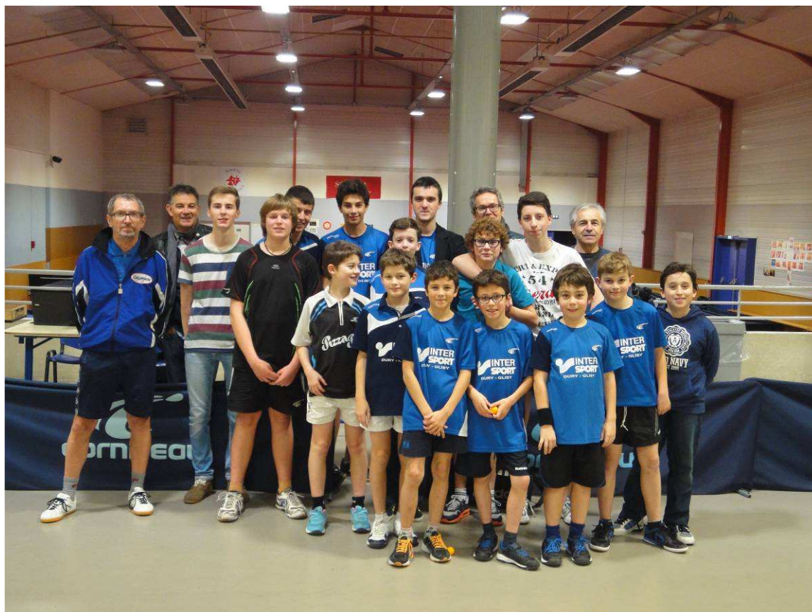
Les participants du tournoi