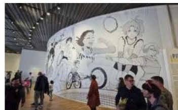
La fresque monumentale n'est qu'un des aspects de l'expo. (B. Zouad)

Amiens (80) Maison de la culture, place Léon-Gontier. Exposition « Ping-pong, à toi de jouer ! » jusqu'au 22 septembre (fermeture du 22 juillet au 19 août).