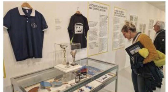
L'exposition La diplomatie du ping-pong mélange objets emblématiques et planches BD.